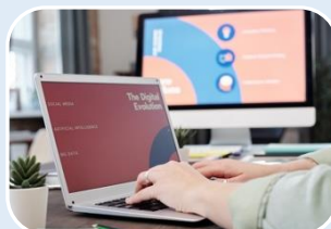
EVALUACIÓN DE MADUREZ