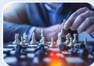
ESTRATEGIAS DE DATOS